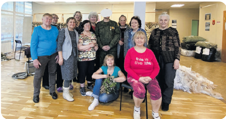
«Бобер» с мастерицами по плетению маскировочных сетей в ОДП-2